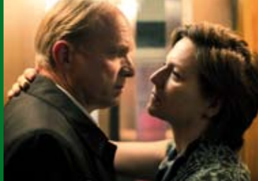
GLEISENDES GLÜCK (DE 2016)