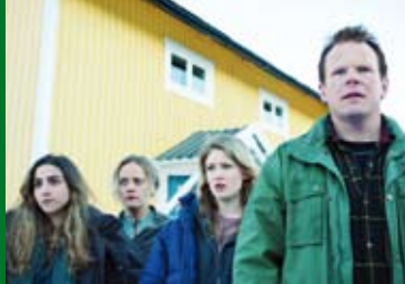
WELCOME TO NORWAY (NO 2016)