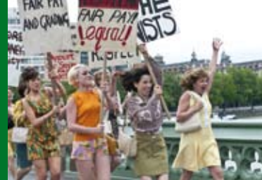
WE WANT SEX (GB 2010)