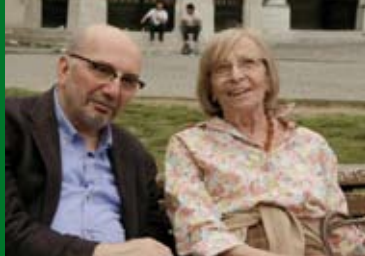
HAYMATLOZ – EXIL IN DER TÜRKEI (DE 2016)

getötet werden. Gemeinsam mit weiteren Insassen bereitet er die Flucht aus der Anstalt vor, ohne zu wissen, dass bald über sein eigenes Schicksal entschieden wird.