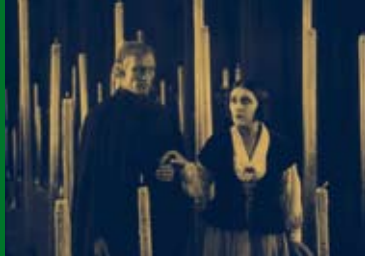
SHORT ORDER – DAS LEBEN IST EIN BUFFET (IR/DE/GB 2005)