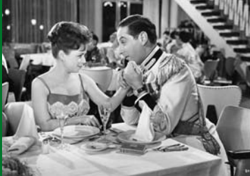
MAJESTÄT AUF ABWEGEN (DE 1958)