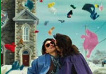
LAURENCE ANYWAYS (CA/FR 2012)