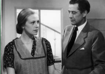
FILM OHNE TITEL (DE 1948)