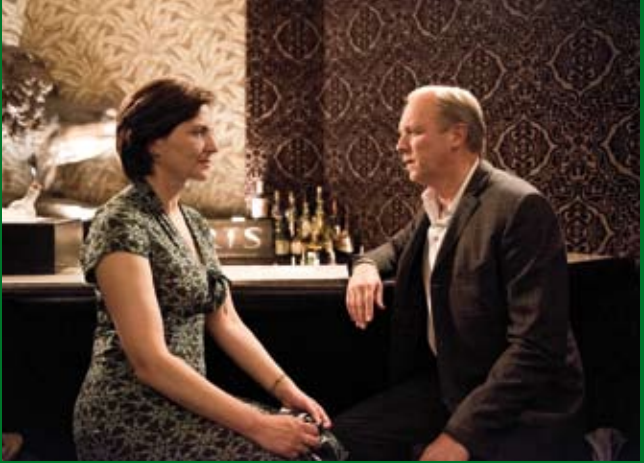
GLEISENDES GLÜCK (DE 2016)

Murnaustraße 6 | 65189 Wiesbaden | gegenüber Kulturzentrum Schlachthof