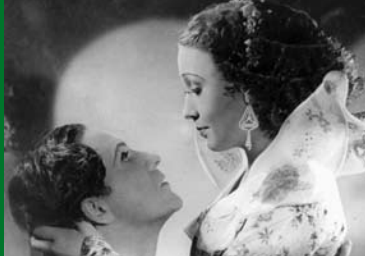
BOCCACCIO (DE 1936)