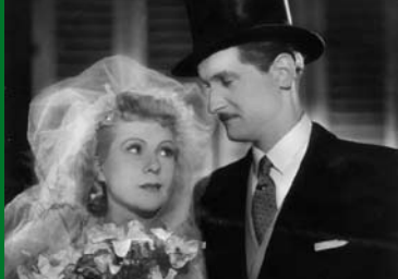
ICH HAB' VON DIR GETRÄUMT (DE 1944)