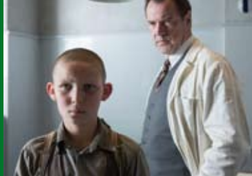
NEBEL IM AUGUST (DE 2015)