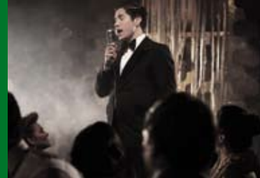
EL MALQUERIDO (VE 2015)