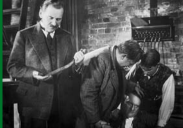
DER SCHUSS IM TONFILMATELIER (DE 1930)