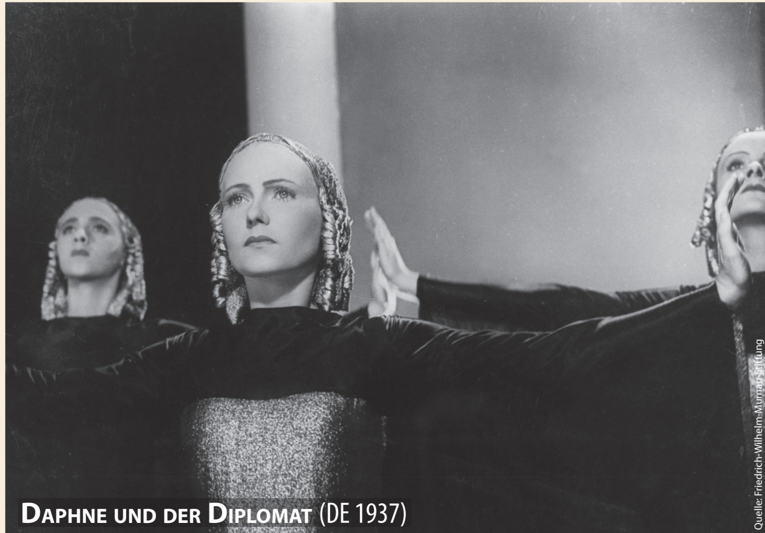
DAPHNE UND DER DIPLOMAT (DE 1937)