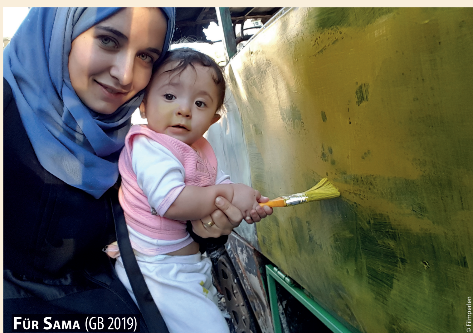
FÜR SAMA (GB 2019)

DF Deutsche Fassung | OmU Original mit Untertiteln