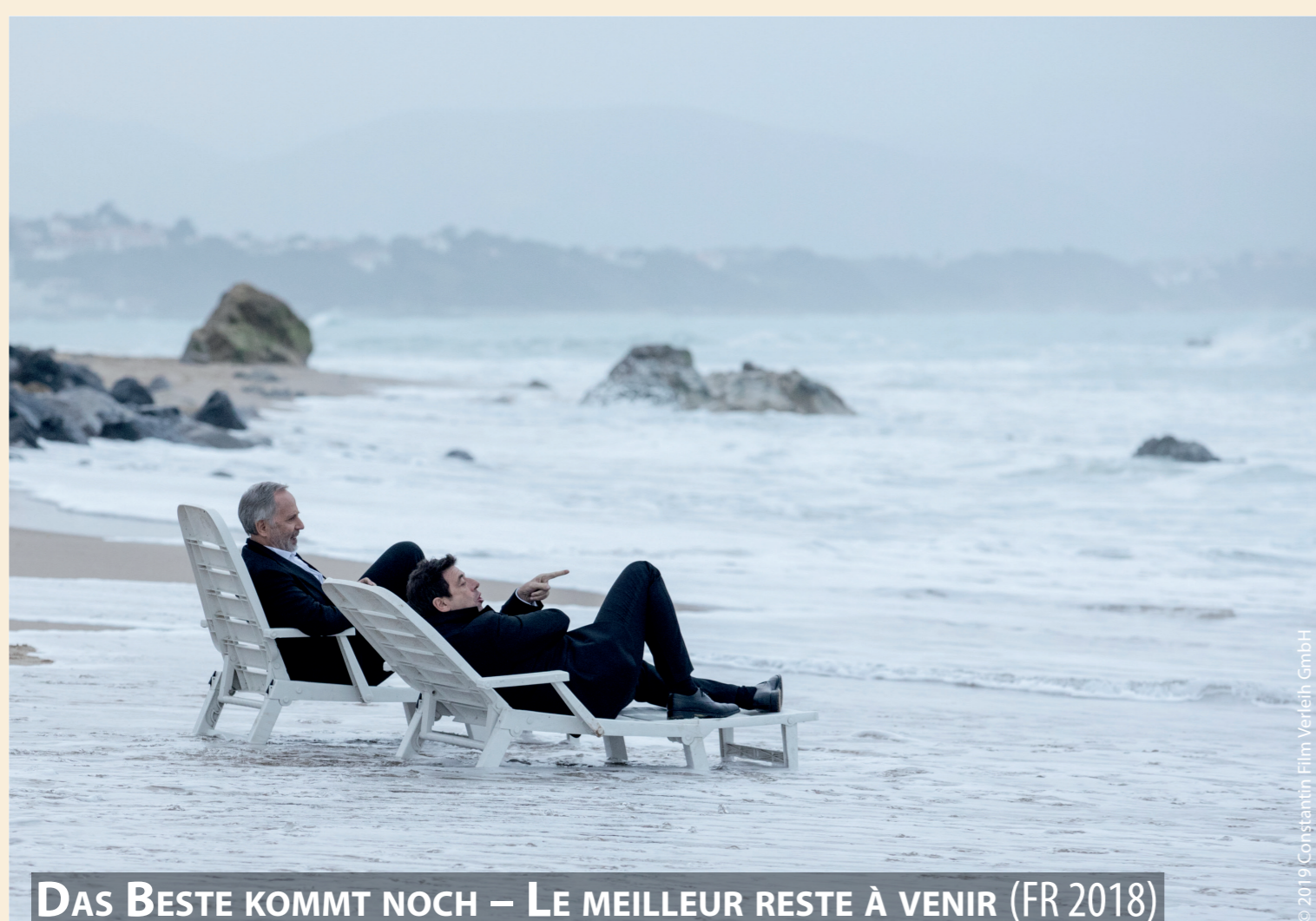
DAS BESTE KOMMT NOCH – LE MEILLEUR RESTE À VENIR (FR 2018)